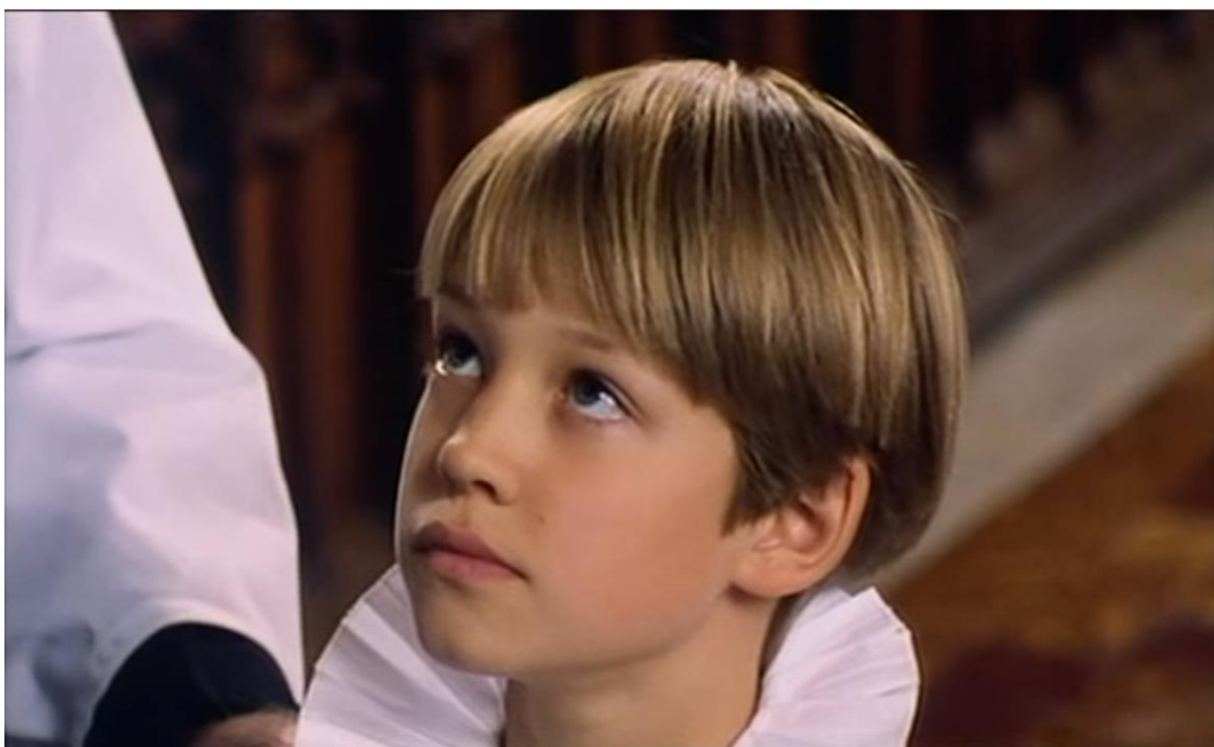
Телесериал BBC «Хор» (The Choir, 1995) В роли Генри Эшворта – первый солист детского хора лондонского Собора Св. Павла Энтони Уэй (Anthony Way). С этой роли началась его настоящая известность.